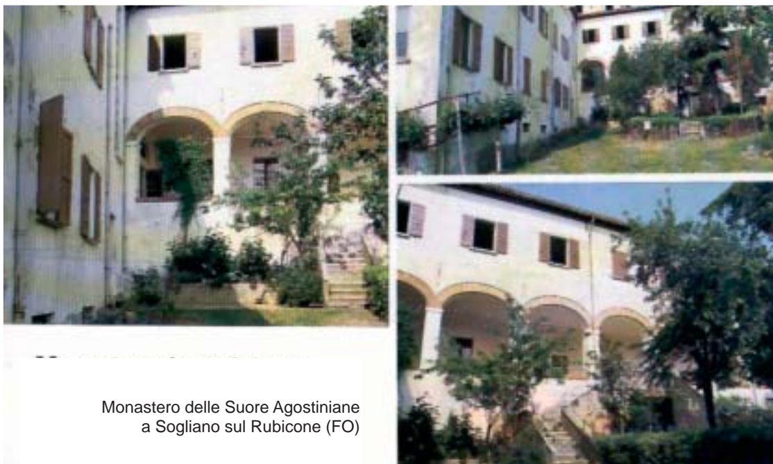
Monastero delle Suore Agostiniane a Sogliano sul Rubicone (FO)