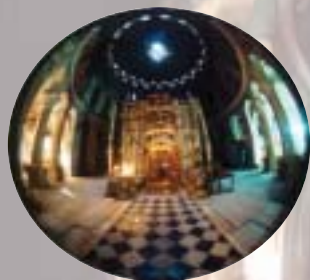
Tomba di Gesù